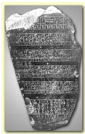
Figure 1.1: Representations of flood data for the river Nile: circa 2500 BC.

dignissim vulputate commodo. Integer vehicula lacus mauris, ac condimentum sem semper ut. Morbi a nulla blandit nibh gravida tempor. Aliquam finibus dignissim lorem, eget maximus eros. Suspendisse ac nibh at massa pulvinar sodales sit amet faucibus ligula. Donec vitae quam scelerisque, aliquam augue vel, ullamcorper ligula. Cras ut aliquet ligula, eu euismod eros. Nulla ele-